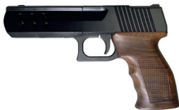
JOKER KURS конструктивно-сходное с огнестрельным оружием изделие кал. 5,6/16К