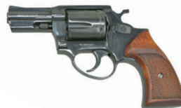
LOM-13 KURS Огнестрельное оружие ограниченного поражения кал. 10x28