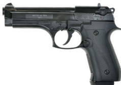
B92 KURS охлажденный пистолет калибр 10 ТК